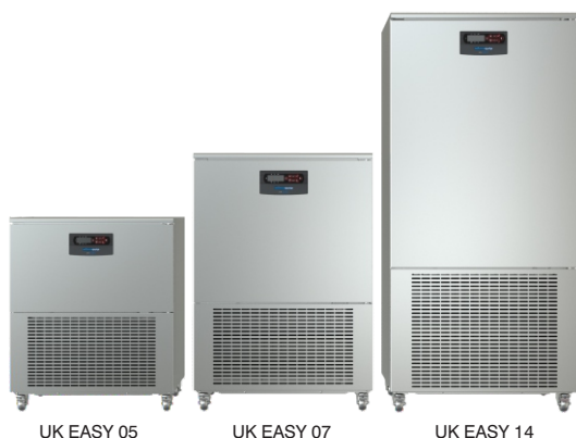
UK EASY 05